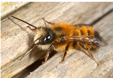
Rosse metselbij.