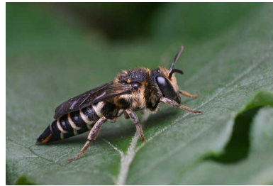
Gouden kegelbij.