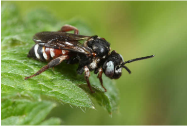
Bonte viltbij.