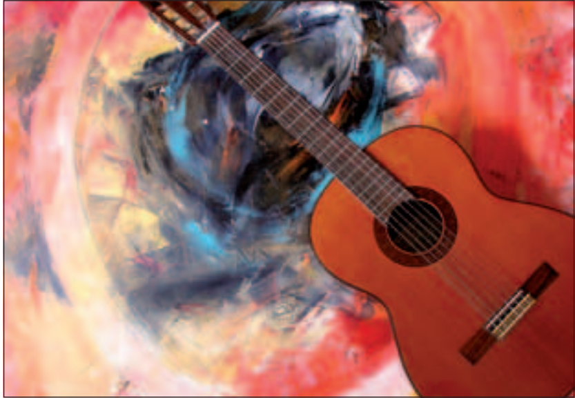
Kom luisteren en kijken naar Groenekans Talent.

Het Open Podium begint om 16.00 uur en eindigt rond 20.00 uur. Gewoon even binnenlopen kan natuurlijk, maar het programma is zo samengesteld dat het leuker is er een gezellig namiddagevenement van te maken. Er wordt, tegen een kleine vergoeding, gezorgd voor een bordje eten en ook drankjes worden geschonken. De toegang is gratis.