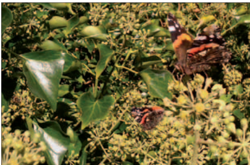
Heder helix arborescens.